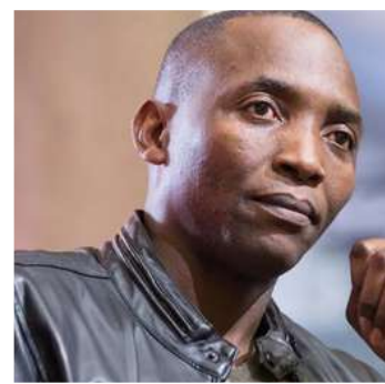
ABOUBAKAR SOUMAHORO SINDACALISTA E POLITICO ITALIANO