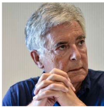
CLAUDIO MARTELLI DIRETTORE DEL GIORNALE AVANTI EX VICE PRESIDENTE DEL CONSIGLIO DEI MINISTRI