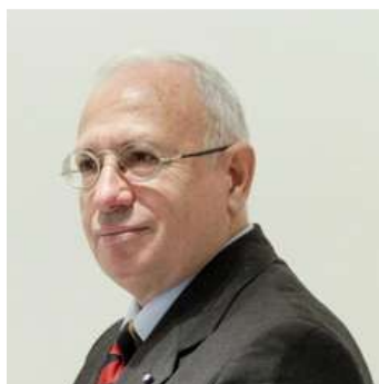
FABIO MINI GENERALE DI CORPO D'ARMATA CAPO DI STATO MAGGIORE DEL COMANDO NATO