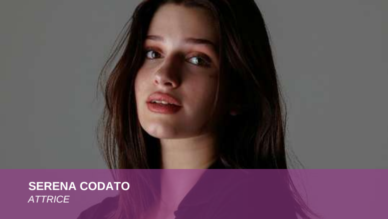
SERENA CODATO ATTRICE