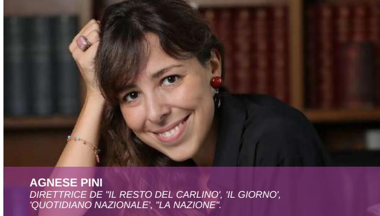
AGNESE PINI DIRETTRICE DE "IL RESTO DEL CARLINO", "IL GIORNO", "QUOTIDIANO NAZIONALE", "LA NAZIONE".