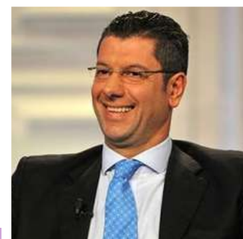
GIUSEPPE SCOPELLITI EX PRESIDENTE DELLA REGIONE CALABRIA