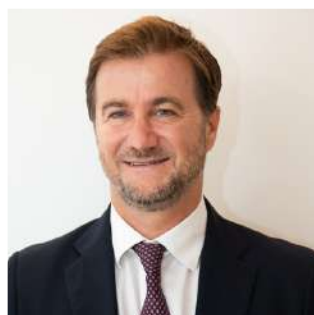
MARCO DE GIORGI CONSIGLIERE DI RUOLO DELLA PRESIDENZA DEL CONSIGLIO DEI MINISTRI