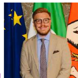
ISMAELE LA VARDERA POLITICO E GIORNALISTA