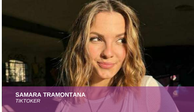
SAMARA TRAMONTANA TIKTOKER